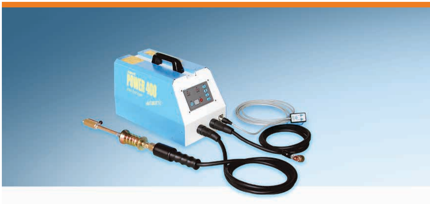
Art. 630SG - Spot Power 400 Evolution, A innesto automatico con comando remoto, trifase 400 Volt