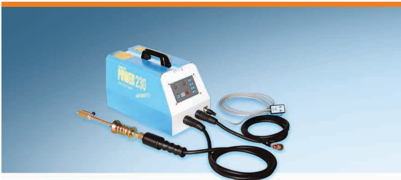
Art. 610SG - Spot Power 230 Evolution, A innesto automatico con comando remoto, monofase 230 Volt